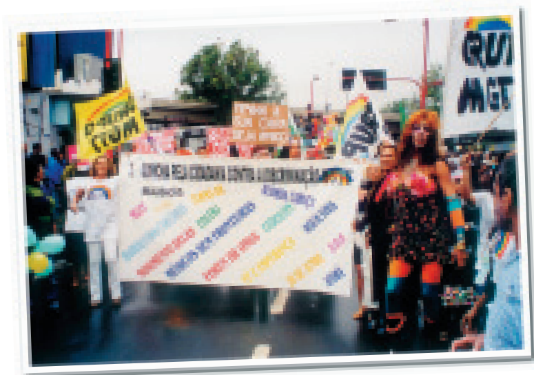
Parada do Orgulho GLBT. Rio de Janeiro/Madureira, 2001

Muitas vezes, e de modo bastante perverso, essa visão negativa compromete a vida e a qualidade de vida de muitas pessoas, colocando-as em situações que violam os direitos humanos.