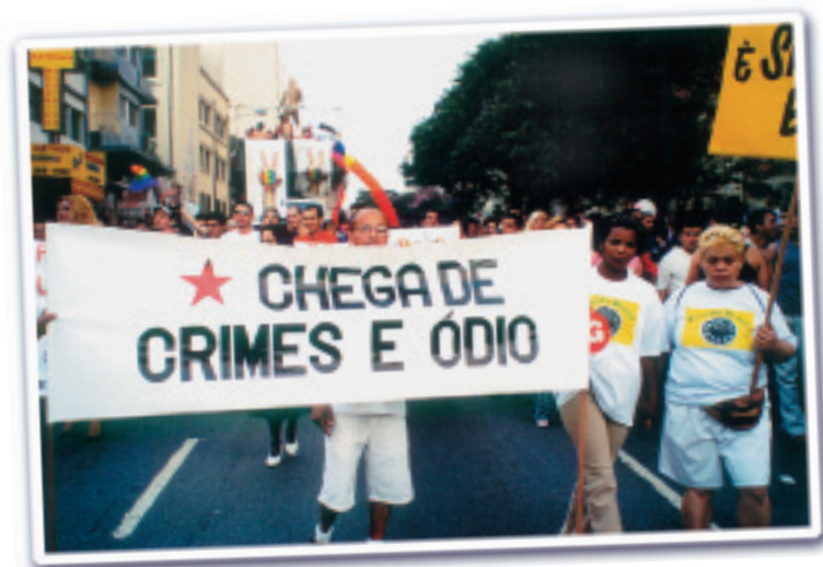
Parada do Orgulho GLBT, 2001. SP