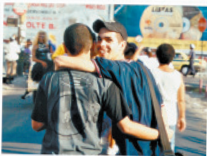
Parada do Orgulho GLBT. Rio de Janeiro / Madureira, 2001

Aliás, temos quase certeza de que, perante a pressão social contra a homossexualidade, se estivéssemos tratando de escolhas, facilmente as pessoas que se sentem atraídas por outras do mesmo sexo optariam por uma outra orientação.