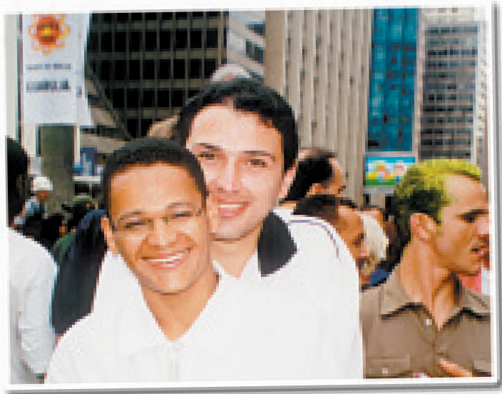
Parada do Orgulho GLBT. São Paulo, 2001

De fato, não se sabe ao certo como uma pessoa se torna homossexual. Sabe-se, sim, que a homossexualidade não é escolha ou opção. Ninguém escolhe ser heterossexual, assim como ninguém escolhe ser bissexual ou homossexual.