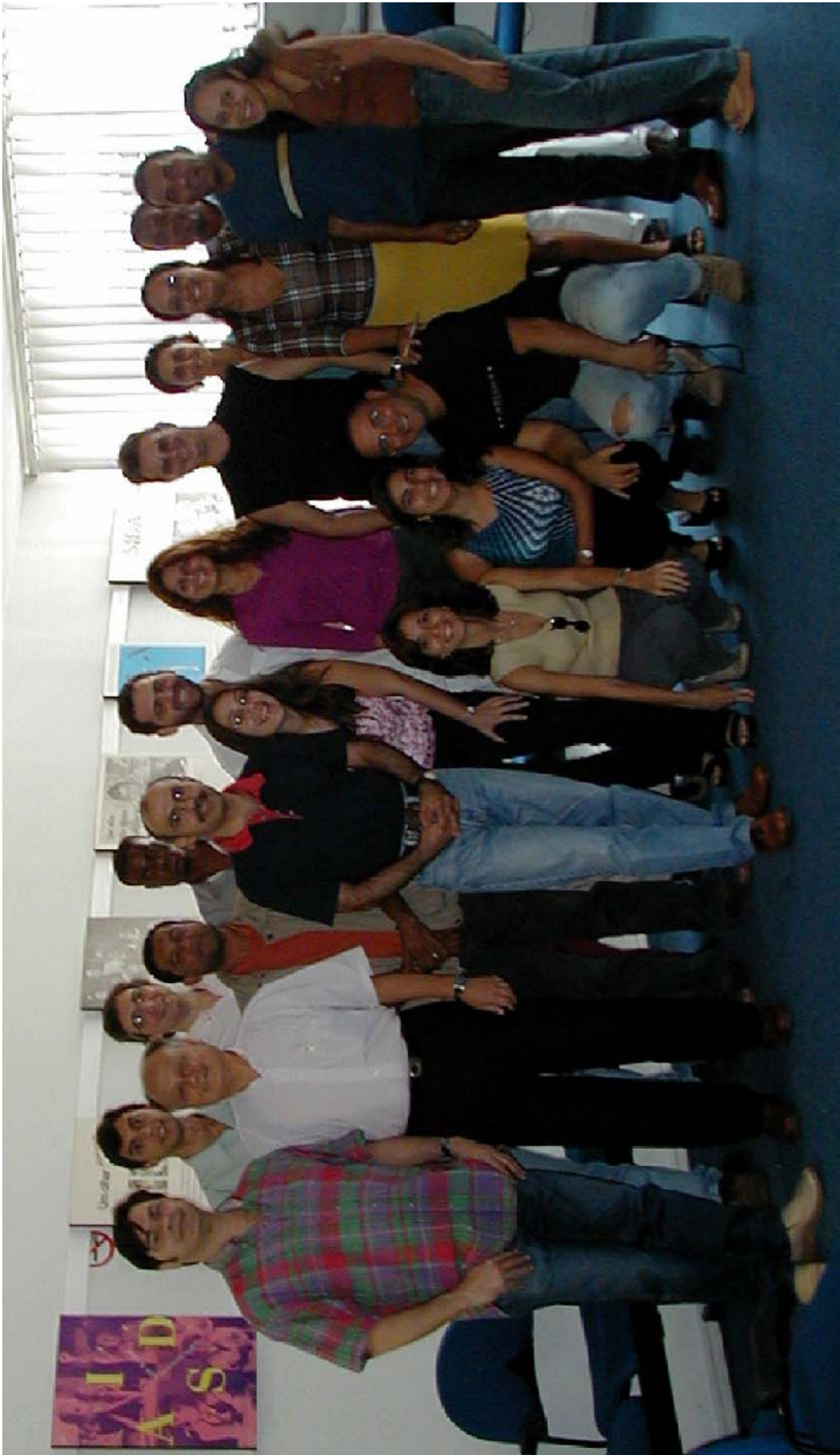
Equipe da ABIA em 2001